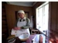
Flatbrød i peisen