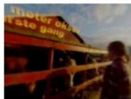
Balder (5) Møter økse