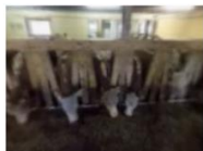
Ku og kalveslepp