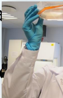
Bioteknologis Nordic Nanovekt