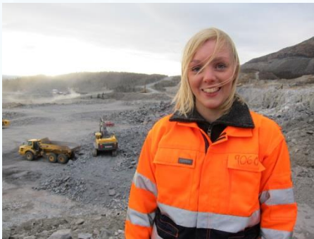
Gruveselskap Rana Gruber