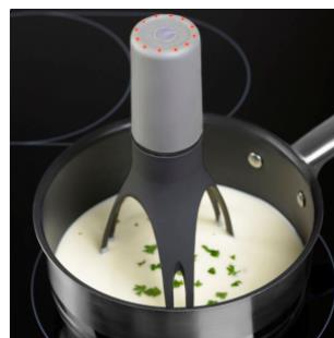
BRIX Stirrtime sauserører